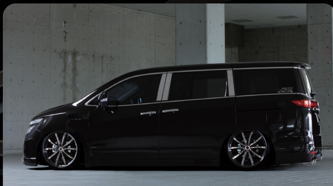
EXE LINE ELGRAND(E52)

22inch F.R. 9.0j+32 TIRE 235/30-22 F.R. +8mm Spacer