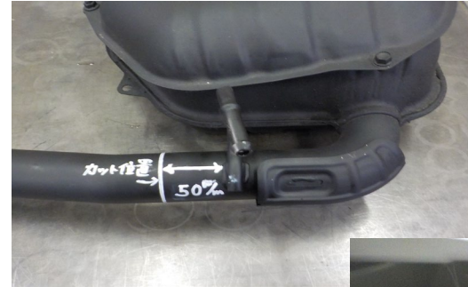
純正マフラーカット 位置写真