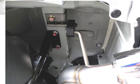
付属ブラケット 装着写真